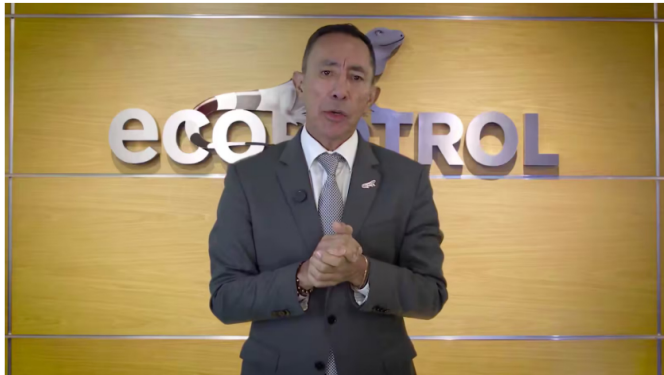
Ricardo Roa, presidente de Ecopetrol, estará 30 días más fuera de la empresa

Ricardo Roa permanecerá 30 días más fuera de la presidencia de Ecopetrol y ahora es por incapacidad médica.