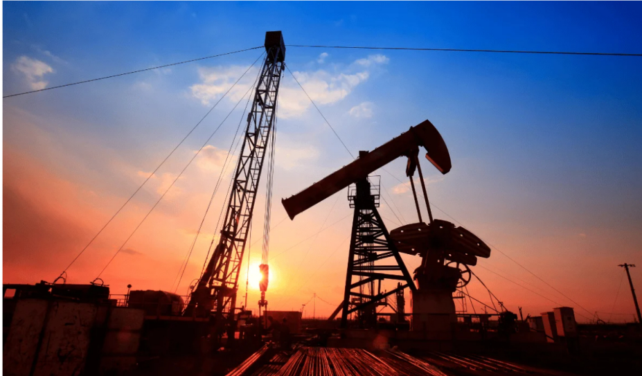
Mercado del petróleo y gas.

“Gran Tierra espera que el contrato de Tisquirama cree sinergias operativas significativas con Acordionero, incluyendo la gestión integrada del agua, la posible implementación de proyectos de gas a electricidad utilizando la producción de gas natural en la zona, y la oportunidad de gestionar los campos como un único centro operativo para mejorar la eficiencia y maximizar el valor a largo plazo”, expresó la empresa.