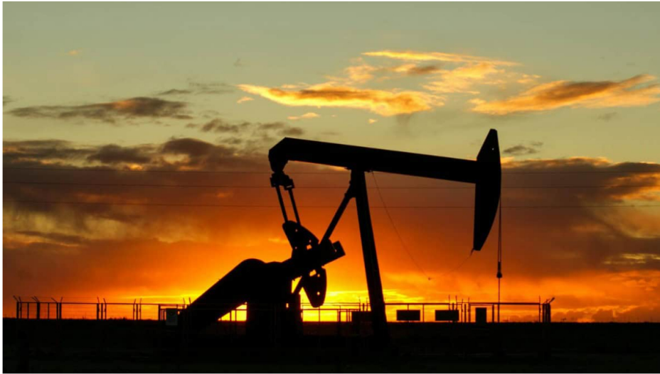
Producción de petróleo.

Por: Manuel Alejandro Correa - 2026-05-28