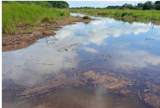
Integrantes de Fedepesan realizaron un monitoreo comunitario en la ciénaga Los Mangos, en la vereda Cuatro Bocas, donde denunciaron presunta contaminación por hidrocarburos.

Compartir Publicado por: Lesly Adriana Cifuentes