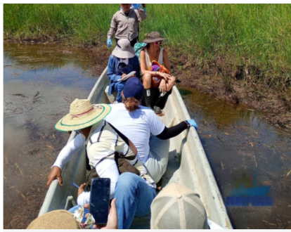
Integrantes de Fedepesan realizaron un monitoreo comunitario en la ciénaga Los Mangos, en la vereda Cuatro Bocas, donde denunciaron presunta contaminación por hidrocarburos.

"Cenit y Ecopetrol rechazan estas acciones ilícitas y hacen un llamado para que cesen los delitos contra la infraestructura de transporte que ponen en riesgo la integridad de las comunidades, generan graves consecuencias al medioambiente y afectan el desarrollo económico del país", indicó la compañía.