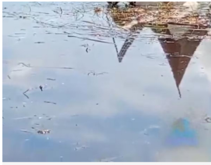
Integrantes de Fedepesca realizaron un monitoreo comunitario en la ciénaga Los Mangos, en la vereda Cuatro Bocas, donde denunciaron presunta contaminación por hidrocarburos.

La dirigente aseguró además que durante las jornadas de monitoreo observaron animales consumiendo agua presuntamente contaminada.