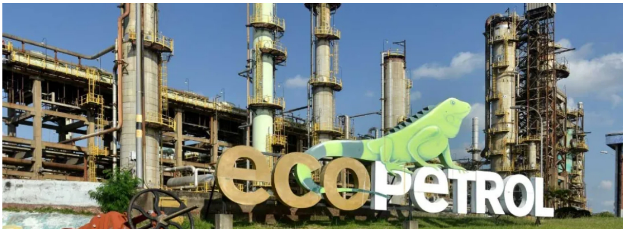
Foto: Ecopetrol registra 150 patentes en 13 países y más de 800 activos de propiedad intelectual que fortalecen la innovación y la competitividad.