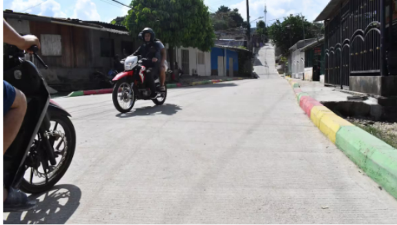
Las obras de pavimentación urbana avanzan en diferentes sectores de Barrancabermeja. Actualmente, los trabajos se concentran en barrios como María Eugenia y El Campín.

Actualmente, los trabajos se concentran en sectores como El Campín y María Eugenia, con labores de excavación, instalación de sardineles y vaciado de concreto para pavimento rígido. Los barrios Divino Niño, Olaya Herrera y Torcoroma están proyectados para el inicio de obras, informó Ecopetrol .