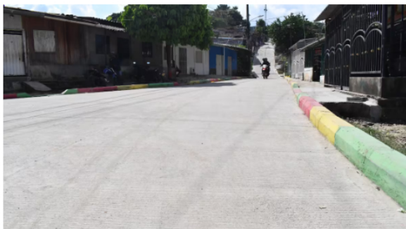
Las obras de pavimentación urbana avanzan en diferentes sectores de Barrancabermeja. Actualmente, los trabajos se concentran en barrios como María Eugenia y El Campín.