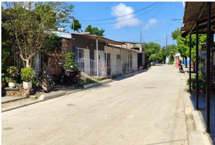
Las obras de pavimentación urbana avanzan en diferentes sectores de Barrancabermeja. Actualmente, los trabajos se concentran en barrios como María Eugenia y El Campín.

Compartir Publicado por: Lesly Adriana Cifuentes