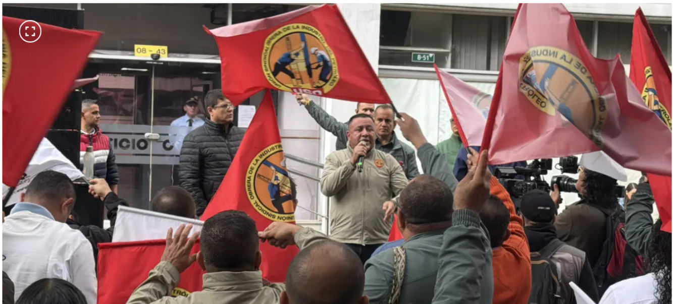
USO sindicato de Ecopetrol

El sindicato señaló que esto es clave para el sostenimiento de Ecopetrol.