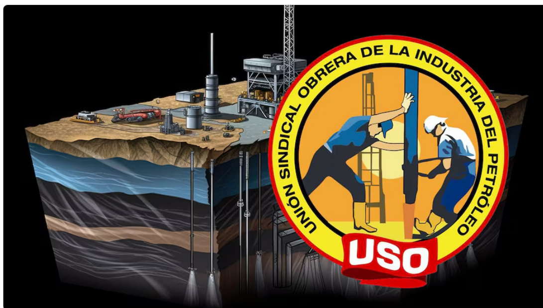
USO (el sindicato de Ecopetrol) y de pozos de fracking.

La Unión Sindical Obrera (USO), principal sindicato de los trabajadores de Ecopetrol, hizo un llamado a los colombianos para que, en las próximas elecciones presidenciales, apoyen a un candidato que priorice el futuro energético del país.