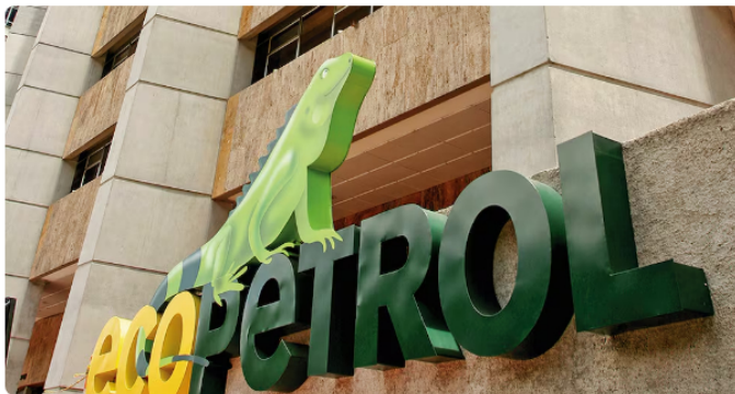
Según la USO, el nuevo gobierno debe volver a priorizar las exploraciones y proyectos de hidrocarburos.

Así, la USO convocó a la ciudadanía, y en especial a los trabajadores de la industria petrolera, a reflexionar sobre las necesidades energéticas de Colombia al momento de acudir a las urnas.